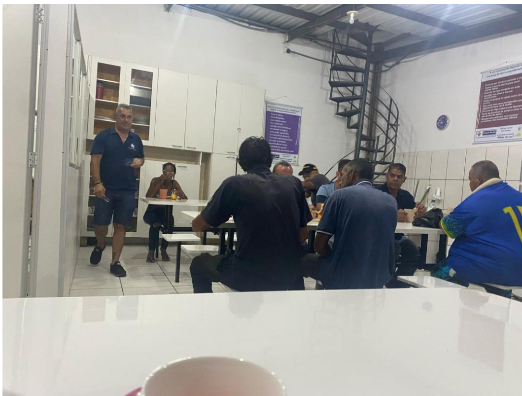
Figura 2: Lanche da Noite, dia 06 de março de 2025