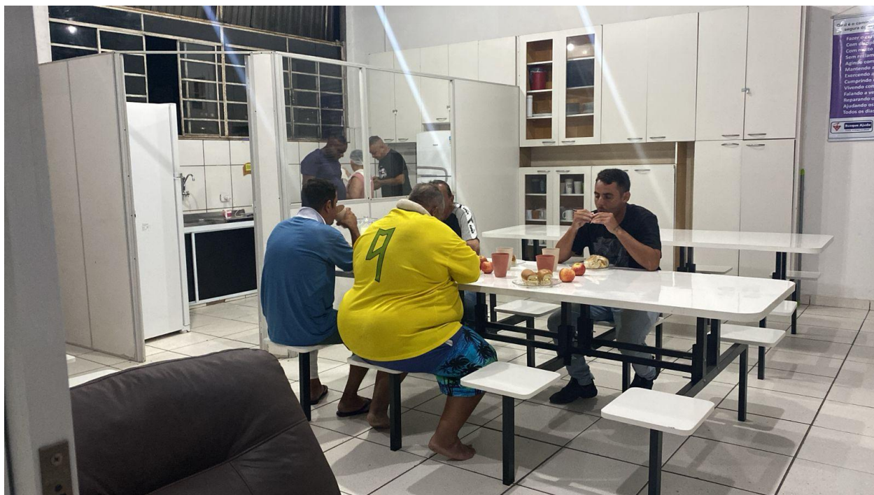
Figura 1: Lanche da Noite, dia 04 de março de 2025