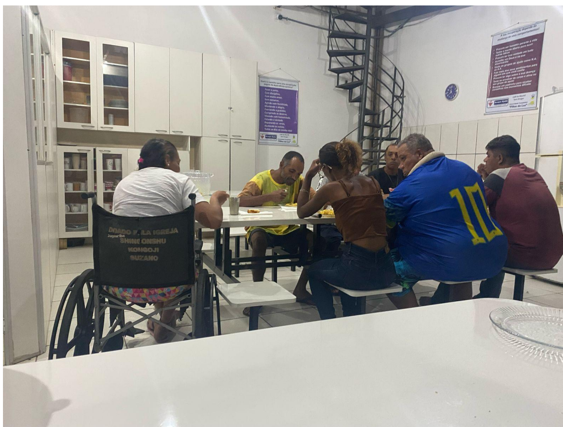
Figura 3: Café da Noite, dia 09 de março de 2025